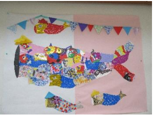
廊下の壁を 元気に

では、先月の宣言通り、こいのぼり制作の成果をお見せしますね。廊下の壁で元気に泳いでいました。ちなみに来月には現在進行形の夏の壁画制作の完成品をご披露出来たらと思います☆