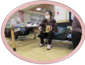
狙いを定めて それっ!