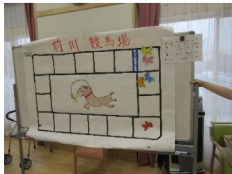
色のついた 割り箸を 引いて…←